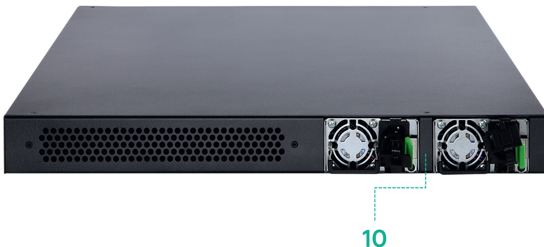
Рисунок 1.2. Задняя панель изделия

Пример внешнего вида задней панели корпуса изделия представлен на рисунке 1.2.